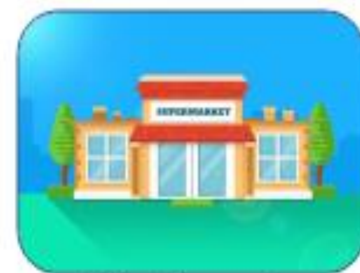
Point de vente